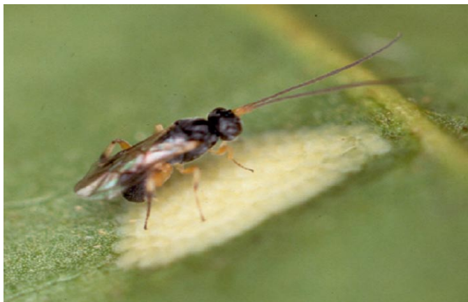
写真1. ハマキガ卵塊に産卵中のハマキコウラコマユバチ

寄生蜂や寄生バエなどの寄生性昆虫の多くは、農業害虫の天敵として知られている。これら天敵昆虫が寄主を発見し産卵するまでの行動解析と、手がかりとなる要因を解明するための研究を行っている。今までに行ってきた研究から、いくつかの寄主発見プロセスの中で化学物質が重要な働きをしていることがわかってきた。