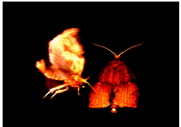
写真3. 雌チャノコカクモンハマキ (右) の腹部先端から出る性フェロモンに誘引されて交尾しようとする雄ガ

また、最近の研究から、寄主に加害された植物由来の揮発性物質を、寄生蜂 (カリヤコマユバチ) が寄主発見の手がかりとしていることがわかってきた。さらに、連合学習によってこの揮発性物質がより効率的に利用されていることがわかった。これらの化学物質と行動の関係について、化学生態学および行動学的手法を用いてのアプローチを試みている。将来、天敵昆虫の行動を制御することにより、生物的防除に役立てることを目標としている。