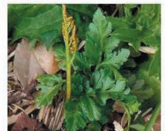
フノノハナワラビ 冬緑性、本～九、陽地

3. 人間の非生物的な活動を通じて地球規模での環境変化が生じている。こうした環境変化は生物の多様性や生産力の変化、植生の移動などをもたらすと予測されている。研究室では、人工的に環境を変えることができる実験施設を用いて、植物（ウキクサなど）に対する温暖化や窒素降下物の影響を明らかにする研究に取り組んでいる。