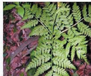
ナツノハナワラビ 夏緑性、北～九、陰湿地