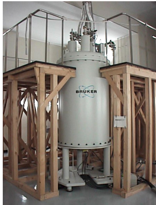
図1. 蛋白質の構造解析に使用する800MHz NMR装置。大きな超電導磁石であり、この中に蛋白質溶液を入れて解析する。蛋白質の中の位置によって磁場の感じ方が異なることを利用して、構造に關する情報を得る。