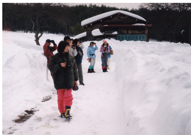
図4 真冬の菅平・自主開催野外実習風景（真冬の野鳥観察）

開かれた施設です。学類生の皆さんには、菅平で開設されている正課の実習への参加を奨めることはもちろんですが、気の合う仲間同士、まとまった休日を利用しての施設利用を是非ともお奨めしたいと思います。きっと、意欲ある皆さんに、センターの教職員の方々は喜んでご協力下さることでしょう。