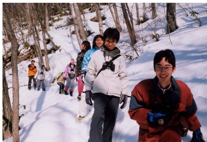
図3 真冬の菅平・自主開催野外実習風景（野生動物を探しながら大明神滝へ向かう）

基礎生物学野外実習がカリキュラムから消えて9年目を迎える今冬、学類の2・3年次生10名ほどが主体となり、かつて私たちが受講した際に用いられた「基礎生物学野外実習D」のテキストを引っぱり出しての、自主的な「学習会」が菅平で開かれたと耳にしました。また、この学習会に、センターの先生方もご協力下さった、と。私にとってもとても嬉しいニュースでしたし、きっと参加された学生も充実した時間を過ごされたものと思います。元々、菅平高原実験センターは、意欲のある学生に