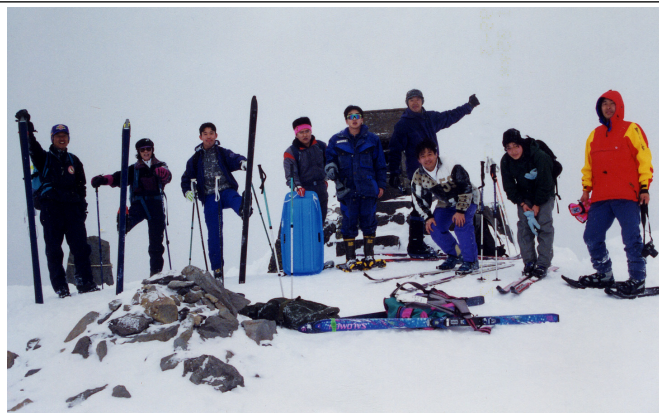
図1 スタッフと大学院生ら、真冬の菅平・根子岳山頂にて（2,207 m：山スキーにて登頂）

実習中、毎朝の食事の際、「氷点下十数度」という、これまでは天気予報の中でしか経験したことのない前日の最低気温の報告を受けながら、そんな過酷な環境の中