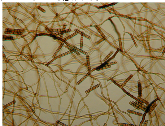
図1: Spoidesmium goidanichii

ると思われる種)を比較した結果、個々の種は年平均気温や年較差の勾配上に狭い最適生育域を持ち、そこを頂点として左右対称の山形の分布パターンを示すことが明らかになった(図1)。このことは、一見ランダムにどこにでも分布しているように思われてきた腐生性微小菌類が、実は維管束植物と同様に気候要因に対応して規則的に分布していることを意味する。