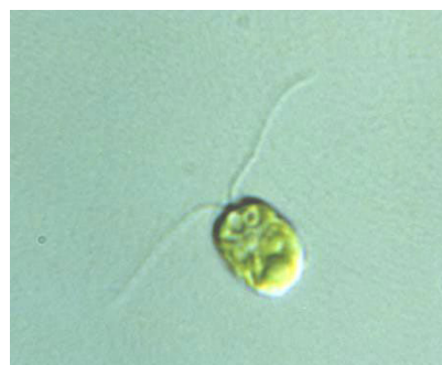
単細胞藻類 クラミドモナス

単細胞藻類は光合成に適した環境に向けて集まり、必要以上に強い光からは遠ざかる。この過程には、鞭毛運動の制御のような真核生物に普遍的な機構と、チャンネルロドプシンによる光受容のような単細胞藻類に特有の機構が関わっている。