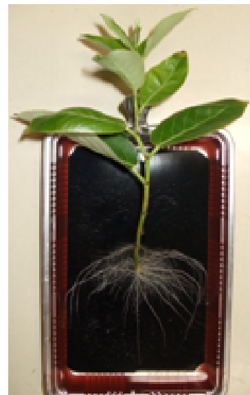
ドロノキの水耕栽培 ( P. maximowiczii )