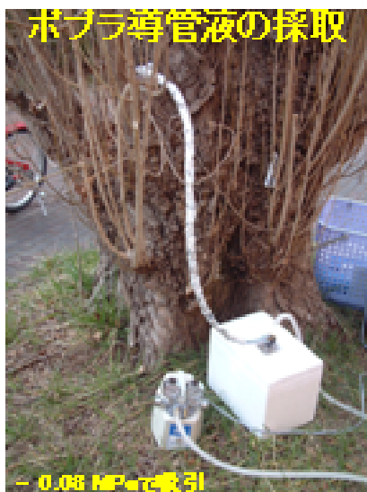
セイヨウハコヤナギ ( P. nigra var. italica )